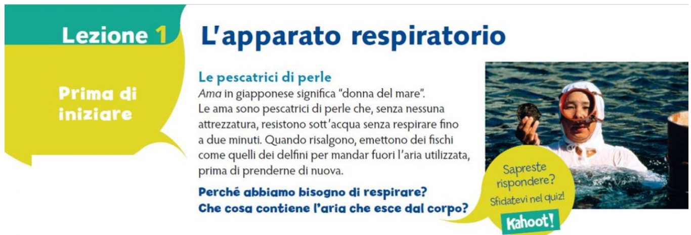
Figura 1 – Prima di iniziare

È per questo che nel testo ogni lezione inizia con la sezione "Prima di iniziare" nella quale viene presentata una situazione inconsueta o divertente o ambigua. L'obiettivo di questa introduzione non è solo quella di catturare l'attenzione, ma anche quello di individuare una domanda che fa da avvio per la lezione. In Figura 1, per esempio, è presentata una situazione particolare, la pesca delle perle in apnea, che racconta questa tradizione giapponese non priva di rischi introducendo efficacemente lo studio della respirazione.