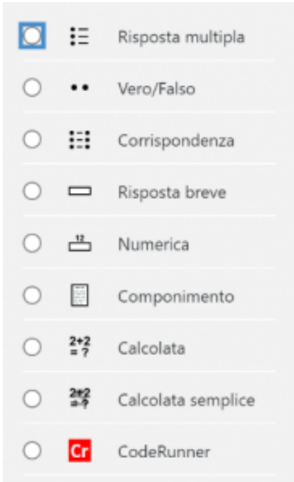
Figura 5 - Tipi di domanda.