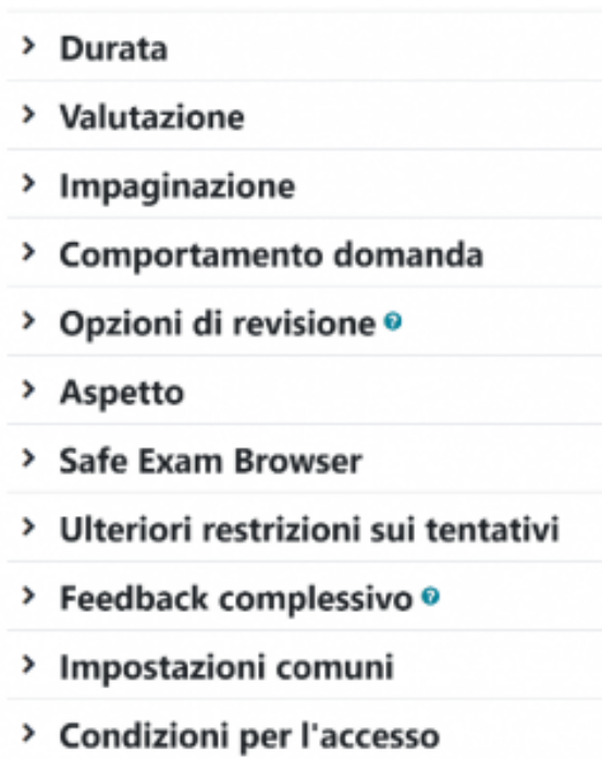
Figura 8 – Proprietà dell'attività quiz.

A seconda di come si configurano le proprietà di un quiz lo si può utilizzare come esercitazione formativa o come verifica sommativa . La figura 8 mostra le proprietà di un quiz; cliccando sulle frecce si visualizzano le scelte che il docente può fare per ciascuna proprietà.