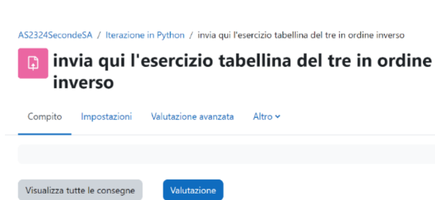
Figura 1 - Attività compito.

L'attività compito serve per consentire agli studenti di consegnare dei lavori sotto forma di file (fig. 1). Il docente può visualizzare le consegne premendo il tasto "Visualizza tutte le consegne"; nella figura 2 sono state tagliate alcune colonne sulla sinistra in cui è indicato il nome dello studente per tutelare la privacy degli utenti; cliccando sul nome dei file sarà possibile scaricarlo sul proprio PC. Cliccando invece sul tasto valutazione è possibile dare un feedback testuale e una valutazione numerica alla prova; naturalmente in questa modalità la correzione della prova dovrà essere manuale a cura dell'insegnante.