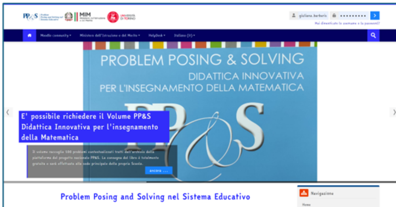
Figura 9 – Progetto PP&S.